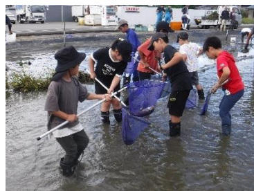
▲放流のため稚魚をすくいあげる子どもたち