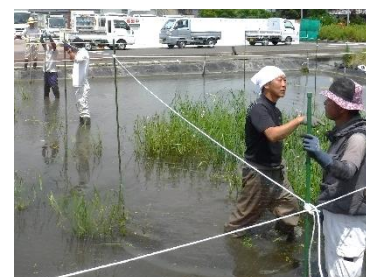
▲防鳥ネットを設置する会員たち