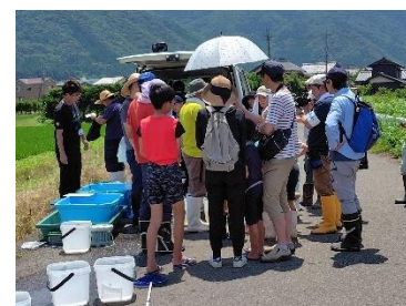
▲観察会に集まった大勢の人たち