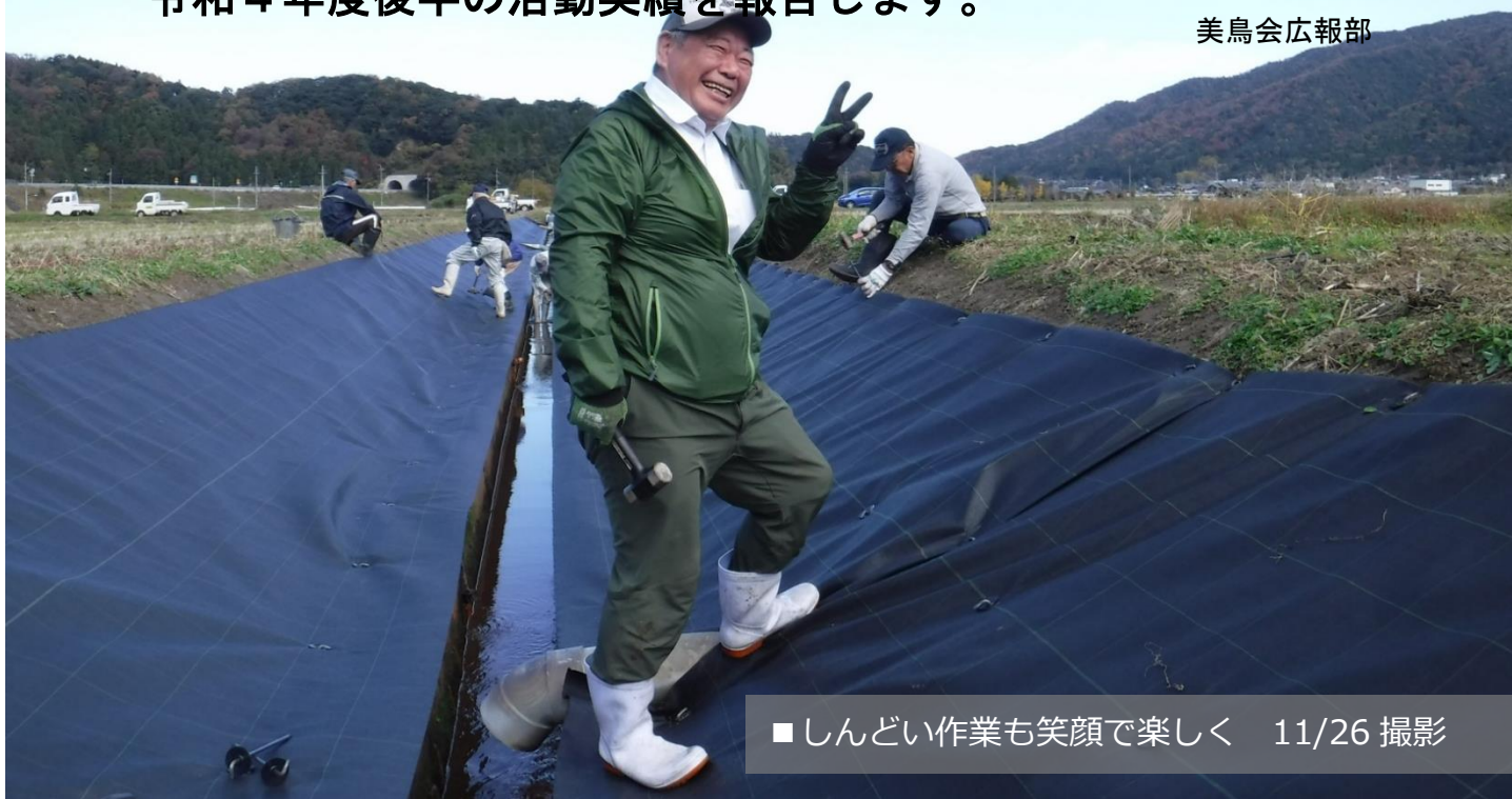
■しんどい作業も笑顔で楽しく 11/26 撮影

明けましておめでとうございます。昨年の活動につきましては、皆様のおかげで無事に活動を進めることができました。本年も美鳥会の活動に対してご理解とご協力を賜りますようお願いいたします。